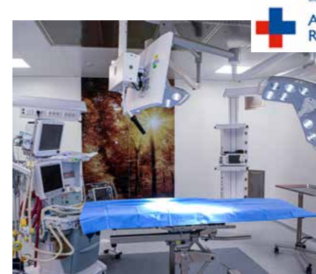
SISTEMA SANITARIO REGIONALE ASL ROMA 2