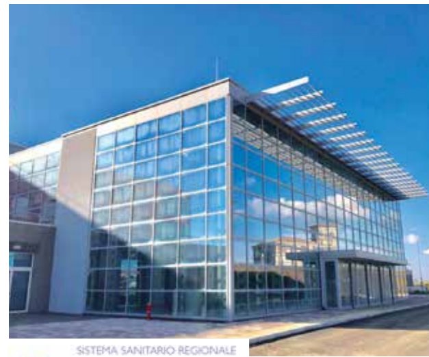
SISTEMA SANITARIO REGIONALE ASL ROMA 6

In agreement with the Regione Lazio, UniCamillus chose ASL Roma 6 as the reference hospital for students internships, as it includes hospital facilities, including the Ospedale dei Castelli, for the implementation of the integration between assistance, teaching and research. Following the updating of the Memorandum of Understanding with the Regione Lazio published in the BUR no. 104 suppl. 2 of 27 December 2019, the San Giovanni Addolorata, San Camillo-Forlanini, Sant'Eugenio, Pertini and CTO Hospitals were added, thus creating an extraordinary training network for the internships available to the University.